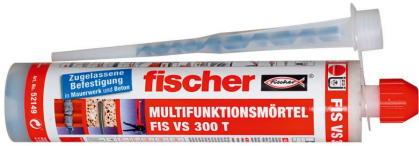
Injektionsmörtel FIS VS